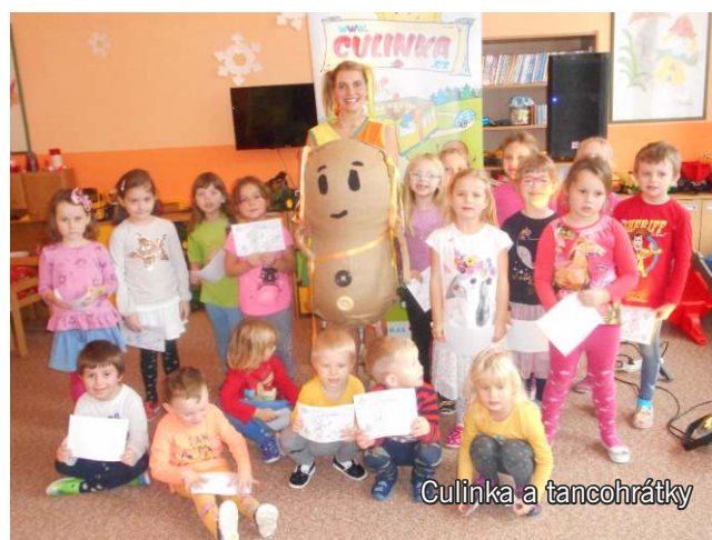
Culinka a tancohrátky