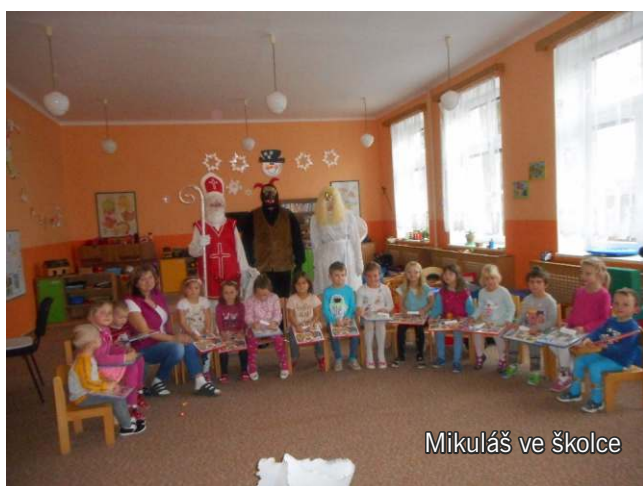
Mikuláš ve školce