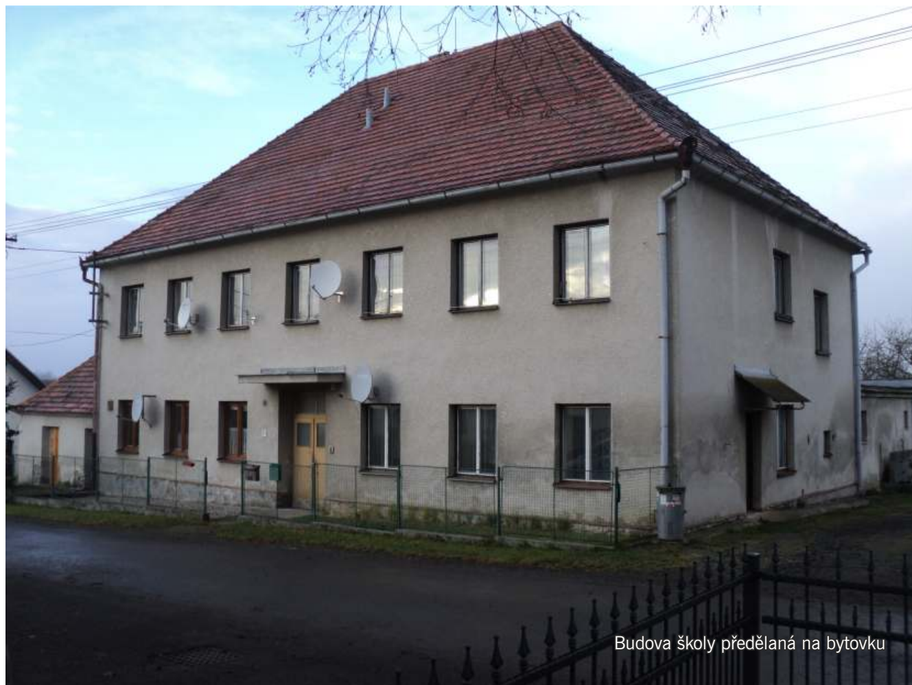
Budova školy předělaná na bytovku