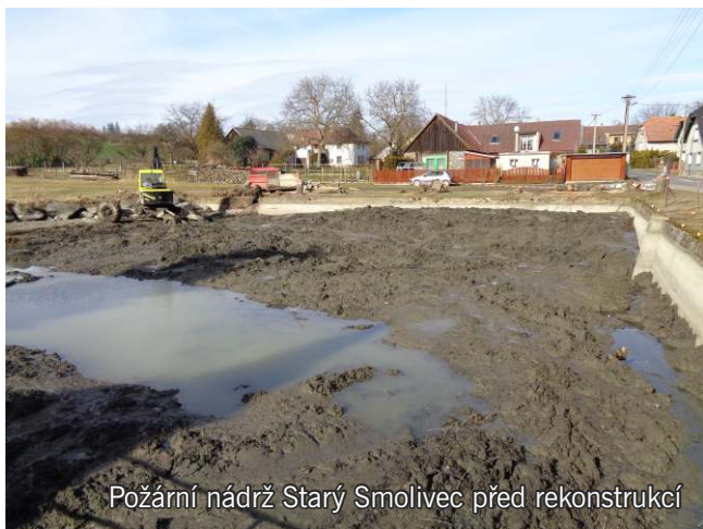
Požární nádrž Starý Smolivec před rekonstrukcí