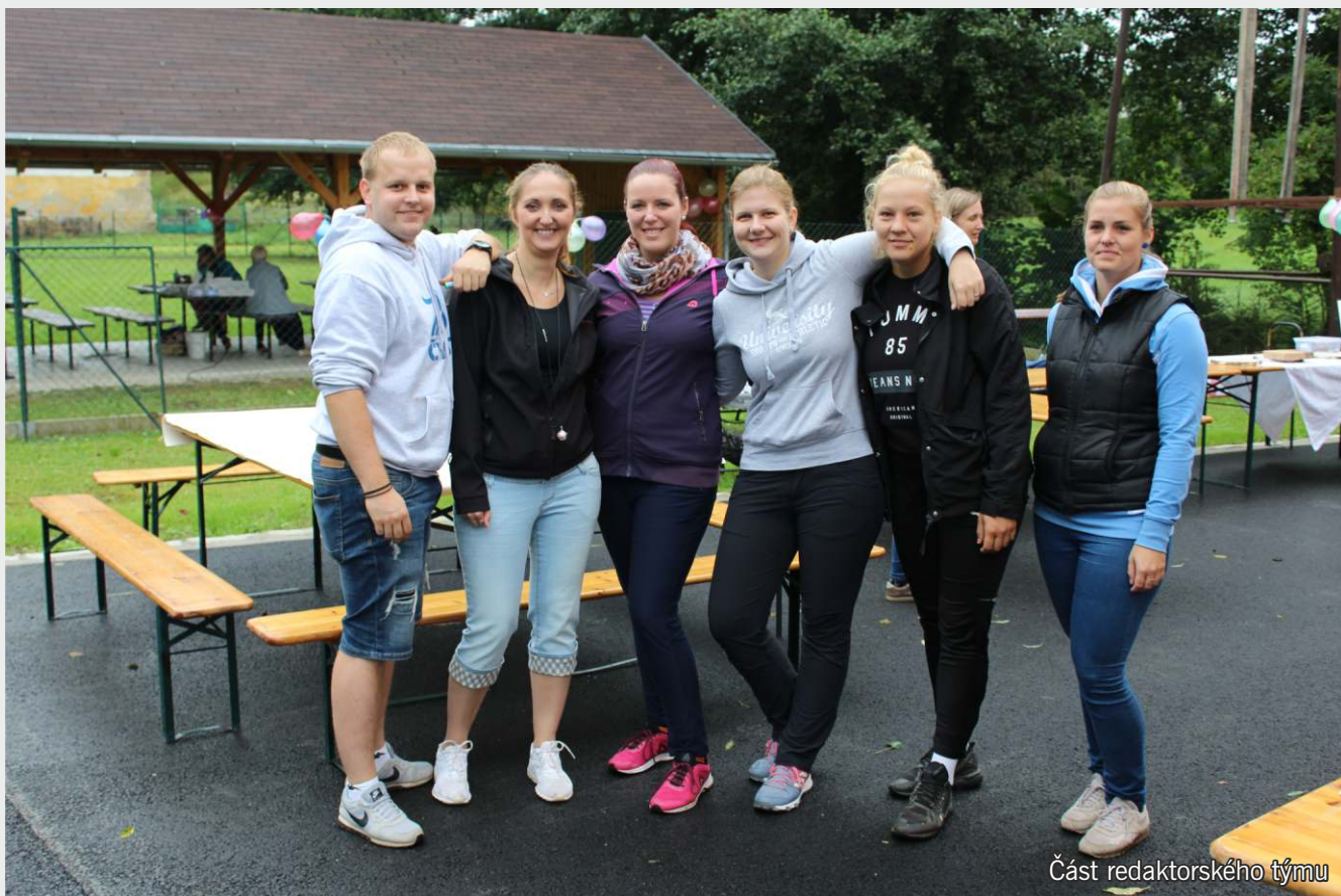
Část redaktorského týmu