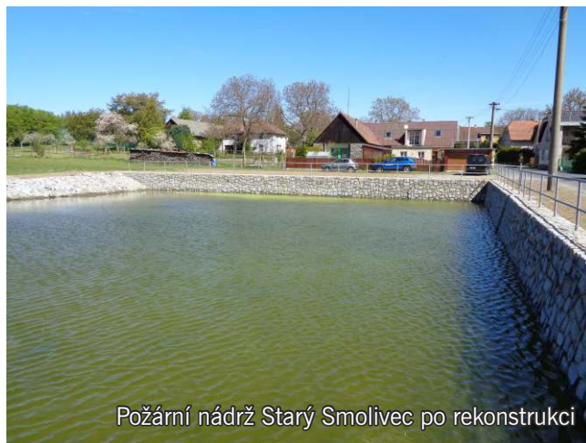
Požární nádrž Starý Smolivec po rekonstrukci