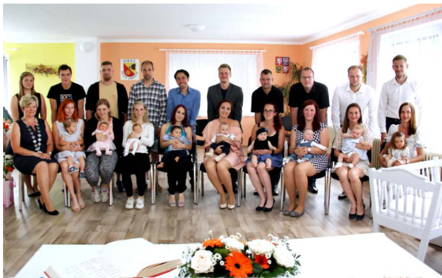
Vítání občánků Mladý Smolivec 17. 7. 2021