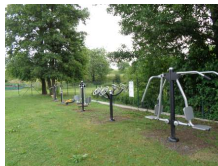
Dětské hřiště Mladý Smolivec