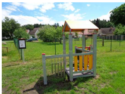
Dětské hřiště Budislavice