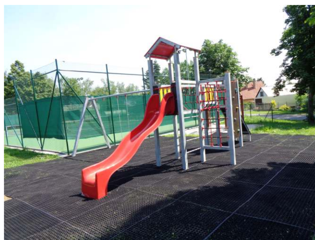
Dětské hřiště Starý Smolivec