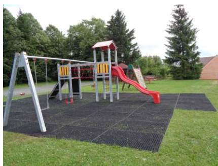
Dětské hřiště Dožice