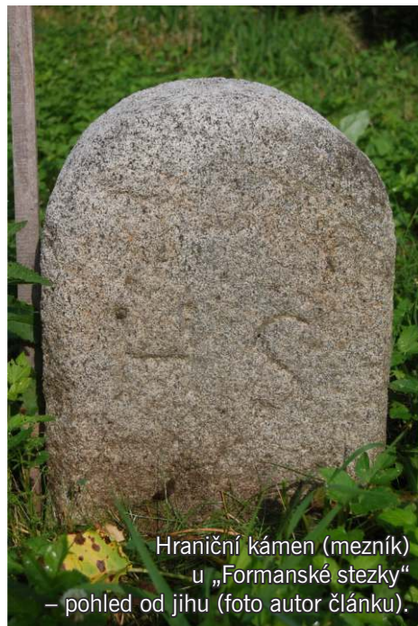
Hraniční kámen (mezník) u „Formanské stezky“ – pohled od jihu.