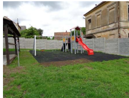
Dětské hřiště Radošice