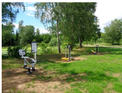
Dětské hřiště Budislavice