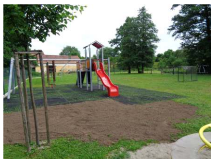
Dětské hřiště Mladý Smolivec