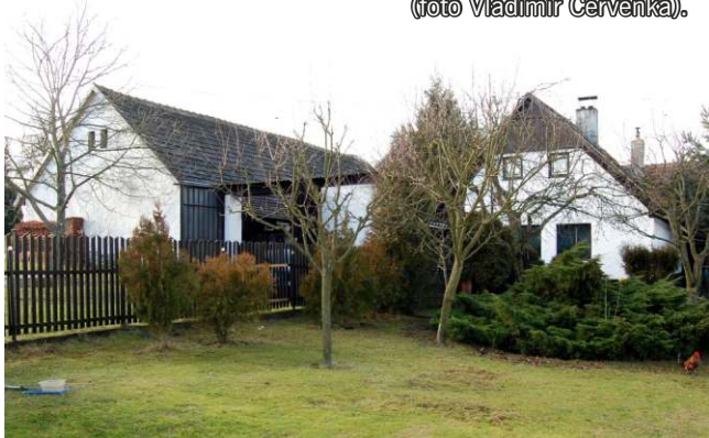
Rodný dům P. Františka Šulce v Útěchovičkách.