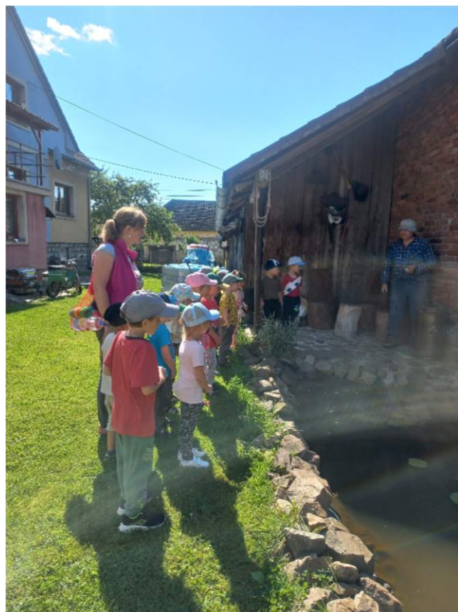
Výlet do ZOO ve Žďírce a návštěva MŠ ve Dvorci.