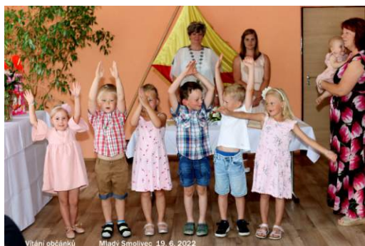
Vítání občánků Mladý Smolivec 19. 6. 2022