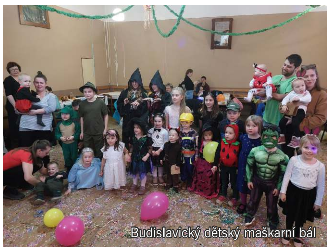
Budislavický dětský maškarní bál