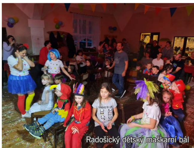
Radošický dětský maškarní bál