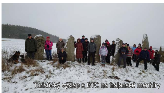
Turistický výšlap s BTO na hajanské menhiry