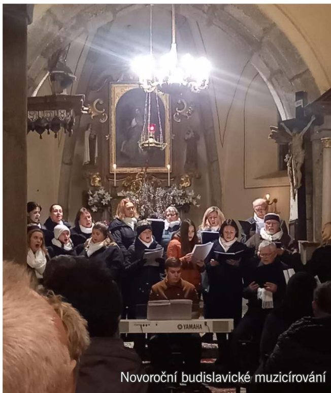
Novoroční budislavické muzicírování

Připomínáme akce z prošího období. Podrobné obrazové zpravodajství na webových stránkách obce.