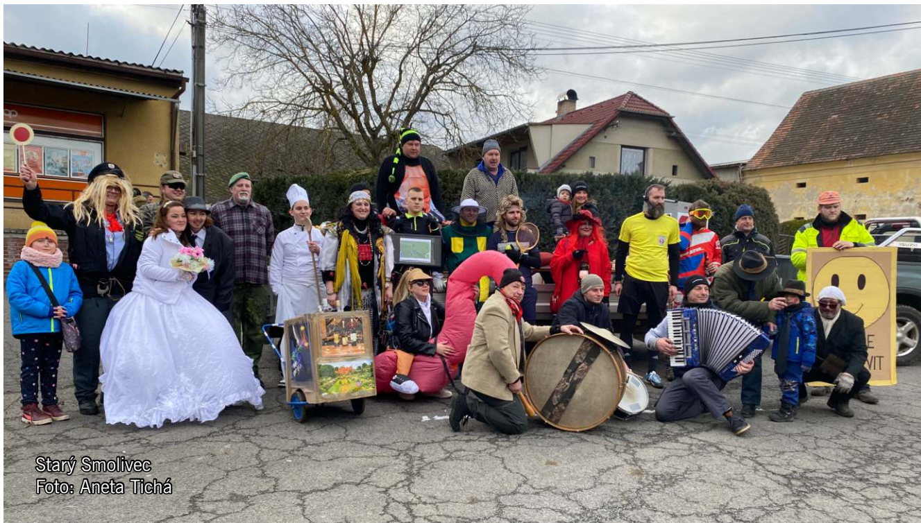
Starý Smolivec