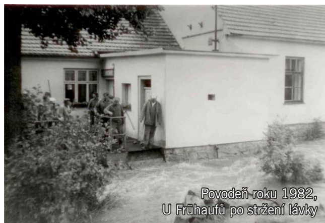
Povodeň roku 1982, U Frühaufů po stržení lávky