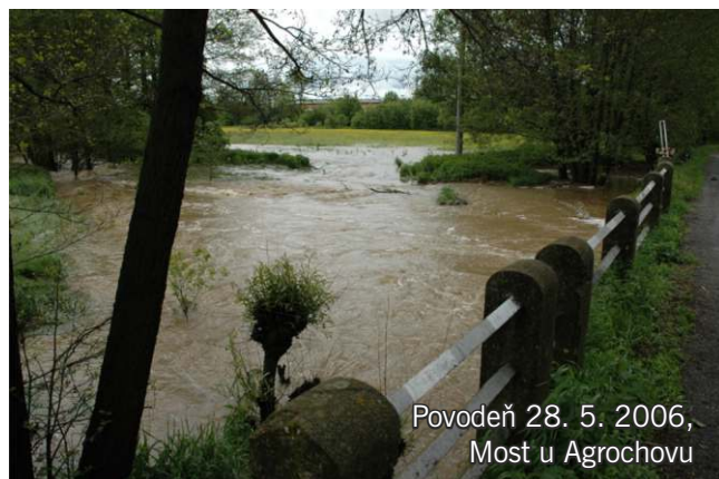
Povodeň 28. 5. 2006, Most u Agrochovu