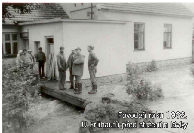
Povodeň roku 1982, U Frühaufů před stržením lávky