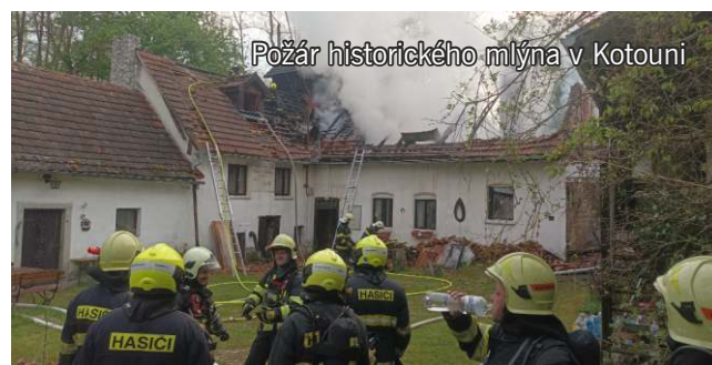
Požár historického mlýna v Kotouni