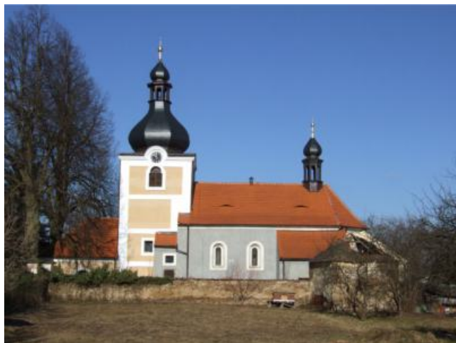
Budislavice - kostel sv. Jiljí autor PhDr. Roman Lavička, Ph.D.

Hlavní církevní stavbou na území obce Mladý Smolivec je kostel v místní části Budislavice, nacházející se ve vlastnictví církve. Postaven byl někdy v poslední třetině 13. století v raně gotickém slohu, roku 1352 se poprvé připomíná jako farní. Od 1. 1. 2020 je kostelem filiálním, když byla k 31. 12. předchozího roku sloučením s Římskokatolickou farností Kasejovice zrušena Římskokatolická farnost Budislavice zahrnující obce