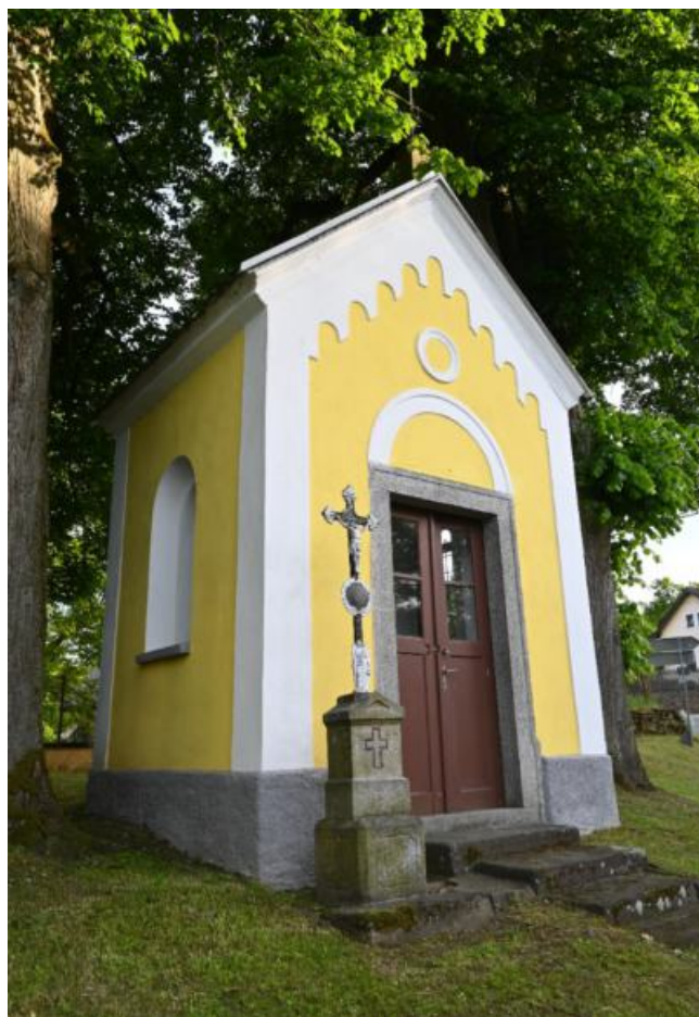
Budislavice - kaple sv. Jana Nepomuckého autor Vladimír Červenka