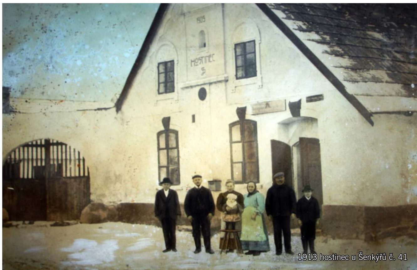
1913 hostinec u Šenkýřů č. 41