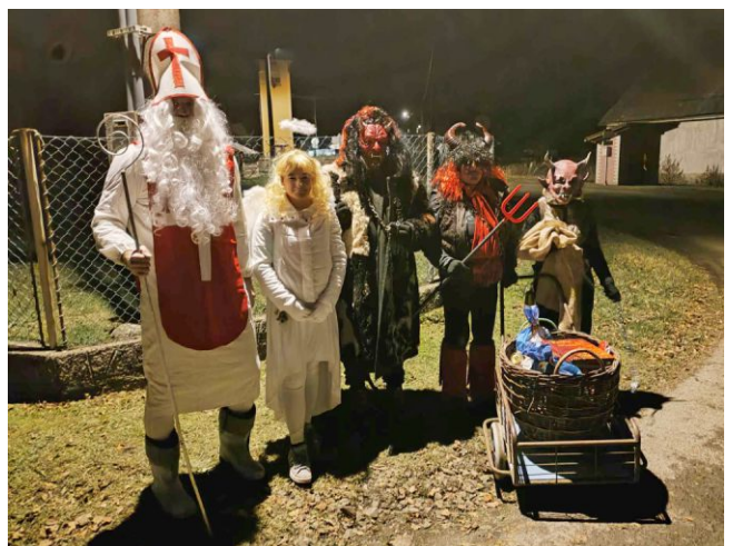
Mikuláš a čerti ve Starém Smolivci