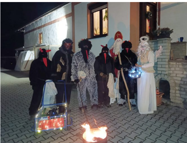
Mikuláš a čerti v Radošicích