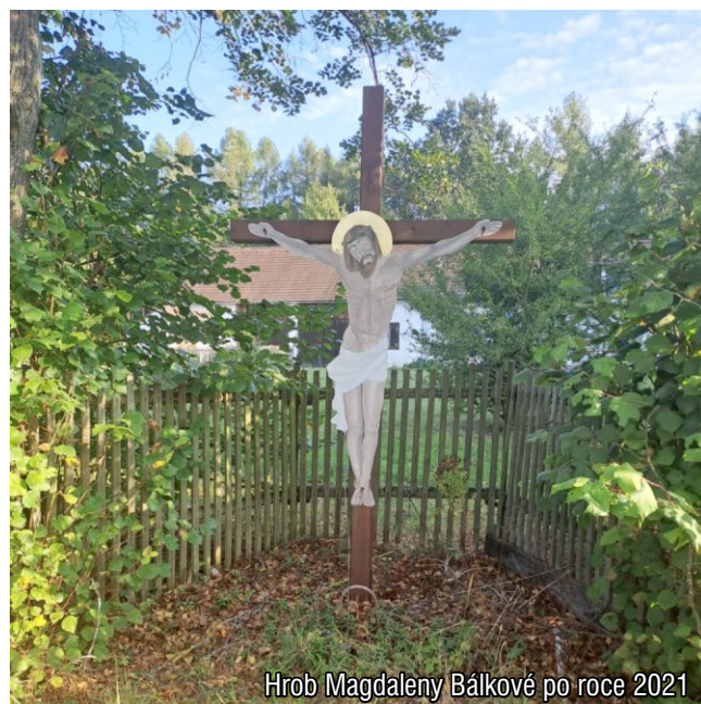
Hrob Magdaleny Bálkové po roce 2021