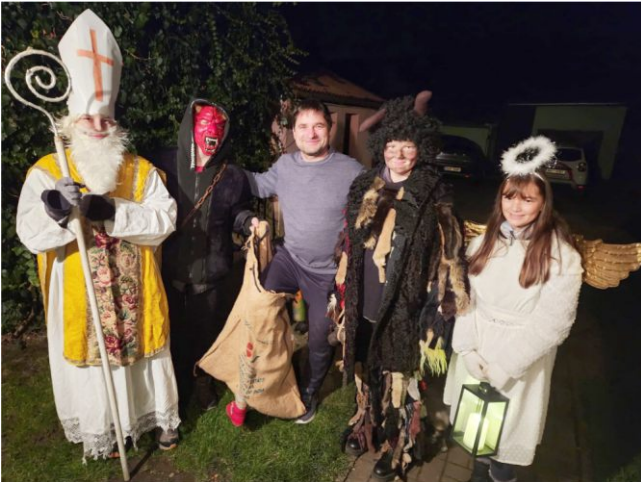
Mikuláš a čerti v Dožicích