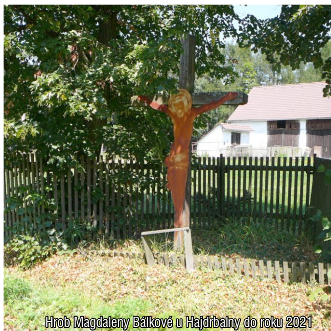
Hrob Magdaleny Bálkové u Hajdrbalny do roku 2021

Zapsala: Ing. Jaroslava Kratochvílová