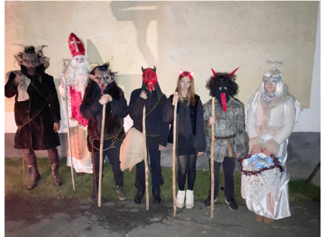
Mikuláš a čerti v Mladém Smolivci