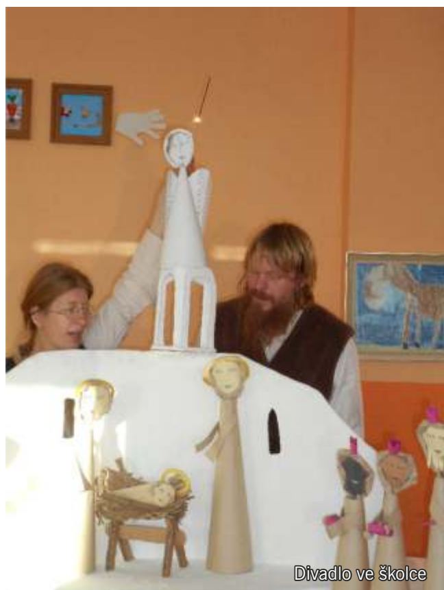
Dívadlo ve školce