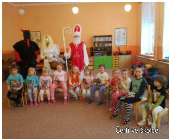
Čerti ve školce