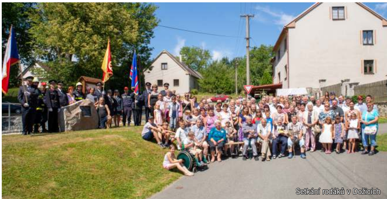
Setkání rodáků v Dožicích