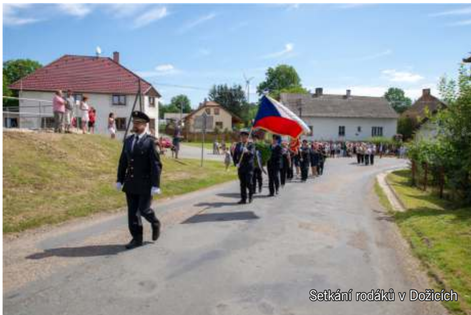
Setkání rodáků v Dožicích