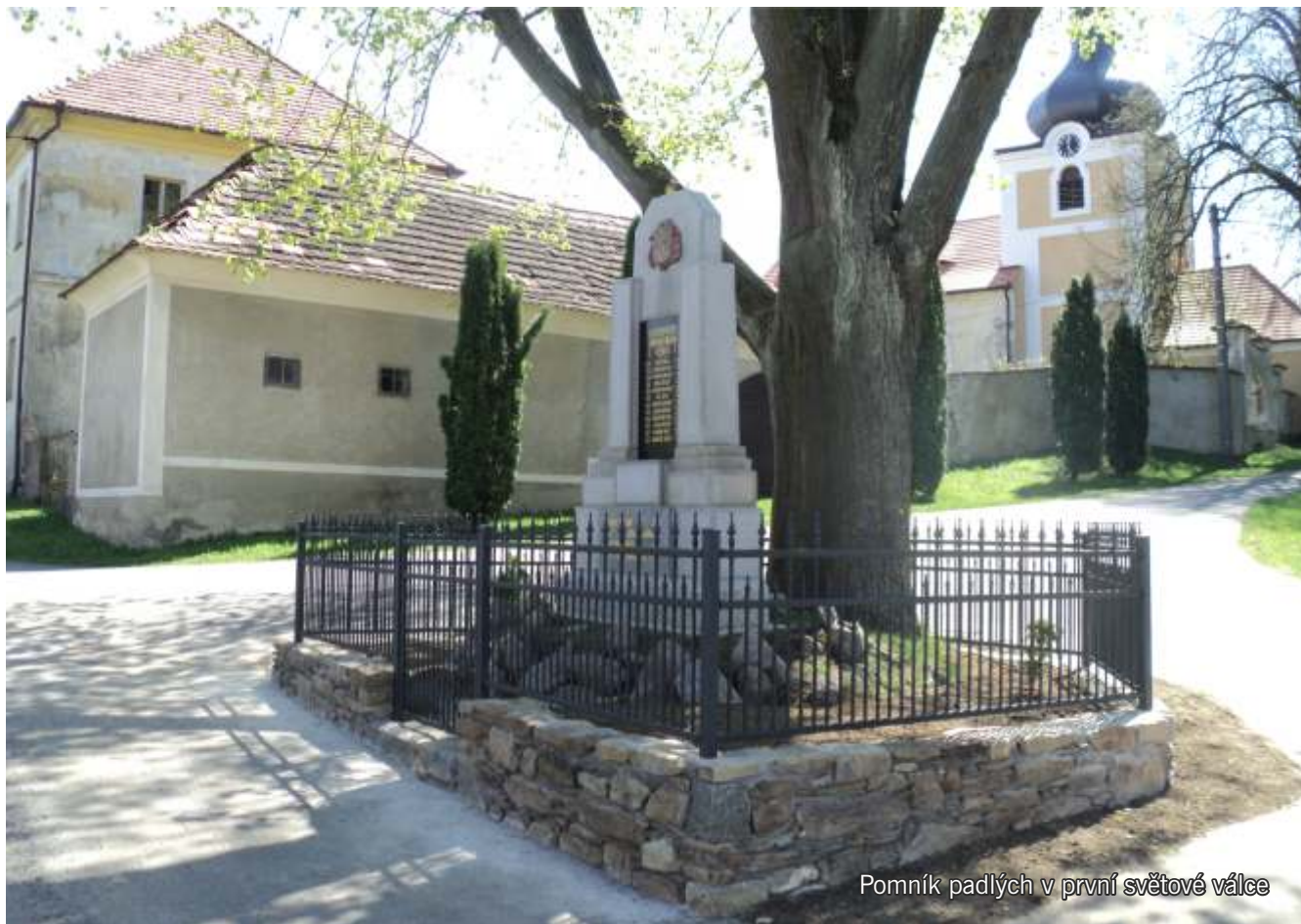
Pomník padlých v první světové válce