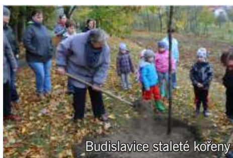
Budislavice staleté kořeny