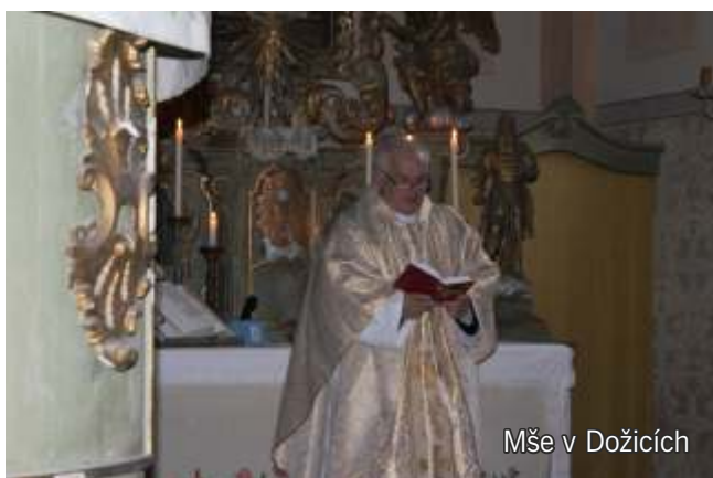
Mše v Dožicích