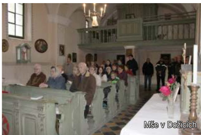
Mše v Dožicích