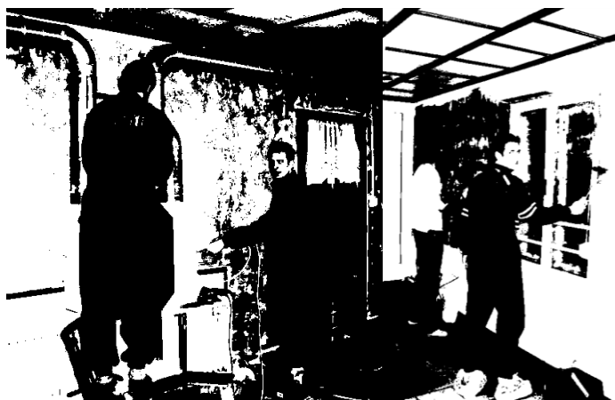
Montování klimatizace a výmalba klubu ...