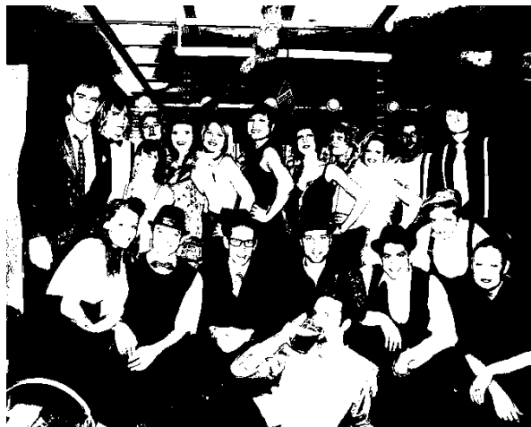
Párty na konci roku 2010 ve stylu 30.let ...