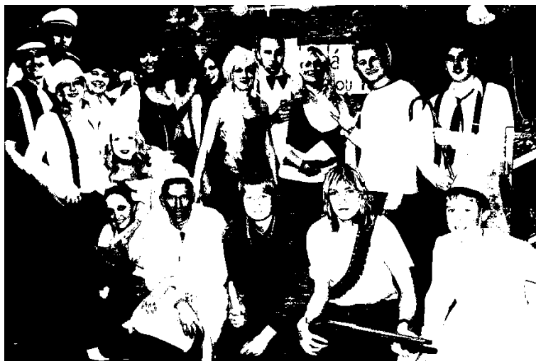
Párty na konci roku 2011 ve stylu filmových hvězd ...