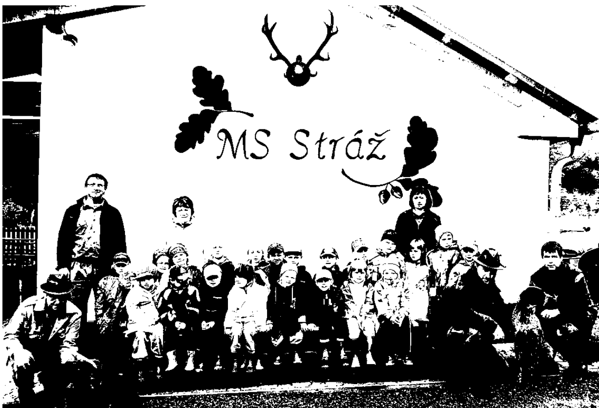
ŠKOLKA STARÝ SMOLIVEC