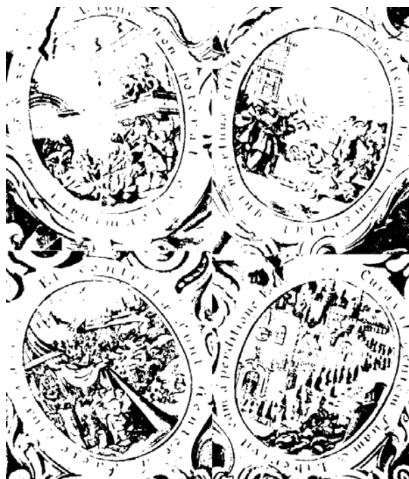
Příběh sochy na rytině z 2. pol. 17. století